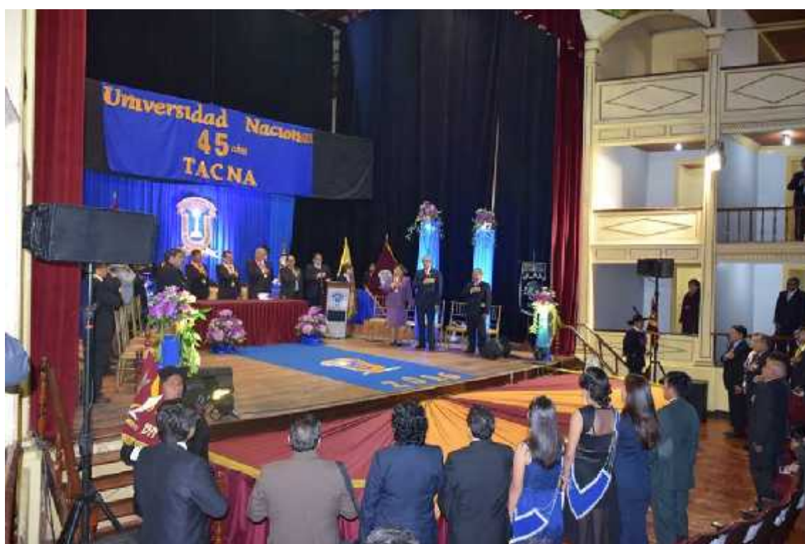
Imagen de la Ceremonia Central de la UNJBG en el Teatro Municipal por su 45 Aniversario

La Gestión Universitaria de excelencia es aquella que con evaluación permanente, interna y externa, orientada a la identificación de oportunidades para la mejora continua de los procesos, servicios y programas en la Universidad centrados en el servicio a nuestra comunidad, proporcionando insumos para la adecuada rendición de cuentas.