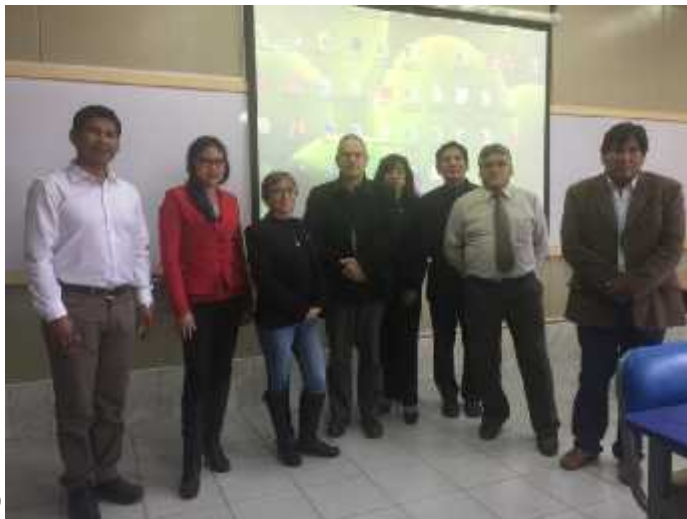
Desarrollo de taller de líneas de investigación de la Escuela, 16 de setiembre del 2016