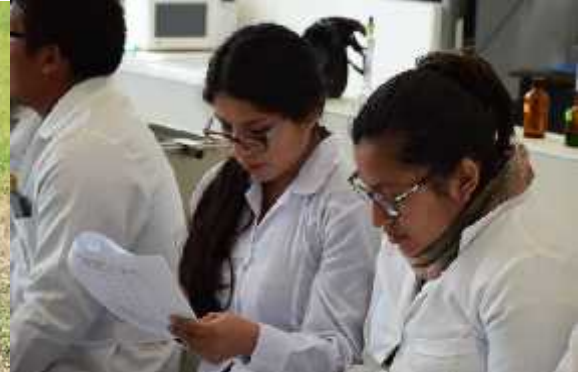
Cuadro General de postulantes 2016.