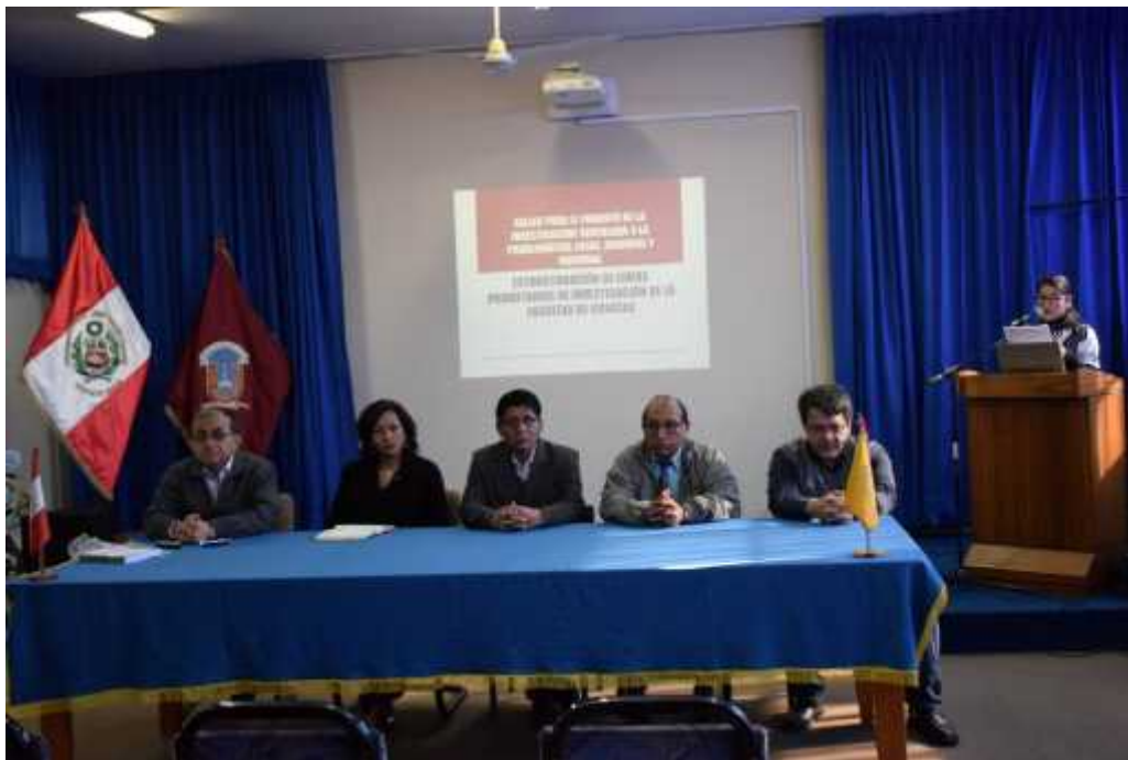
Reunión con el Rector de la UNJBG, para coordinar la creación del Instituto de Células Madre