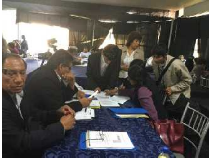
Participación en Taller de Formulación del Plan Estratégico de la UNJBG, 26 y 27 de abril del 2016.