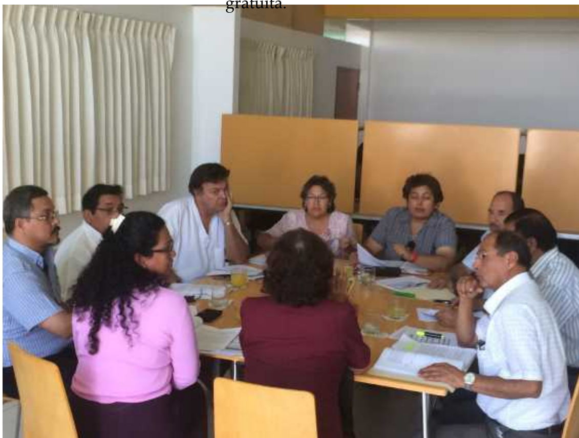
Trabajo. Reuniones de Tutoría Universitaria.