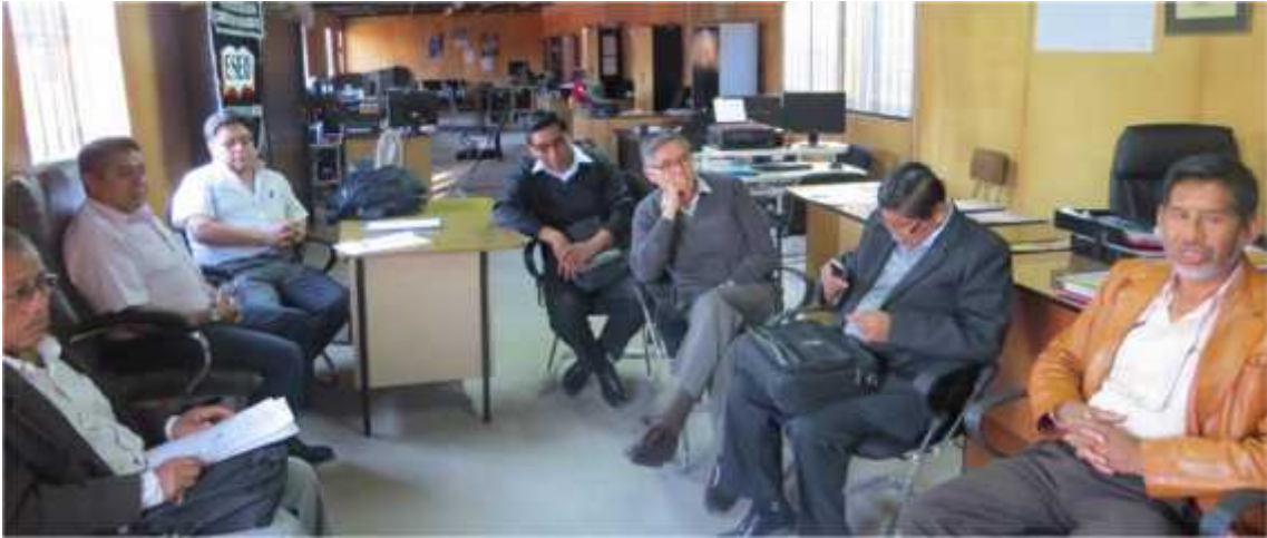
Reunión KAIZEN con Rector