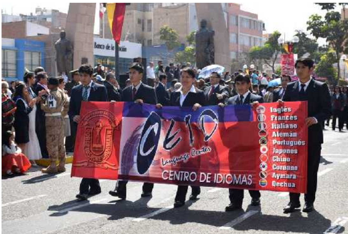
Estudiantes del Centro de Idiomas de la UNJBG participan en desfile Institucional.