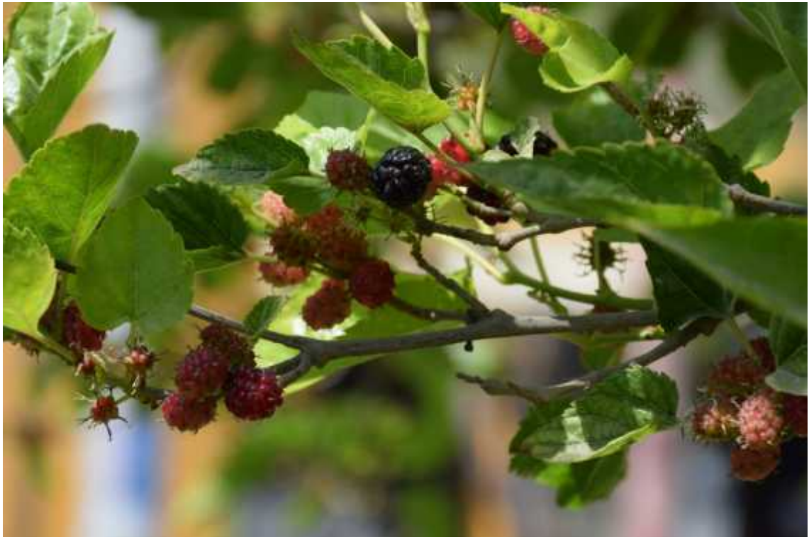
Moras tacneñas. Fotografía de la flora que embellece el Campus de la Ciudad Universitaria.