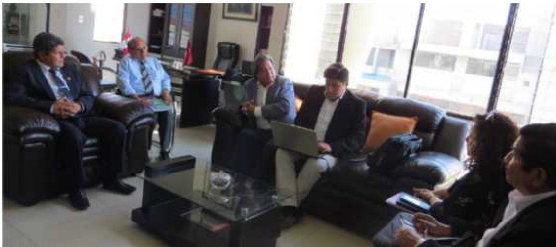
Reunión de KAIZEN con Facultad de Educación, Comunicación y Humanidades