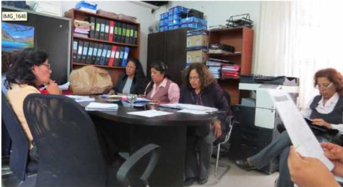
Reunión en Rectorado con Consultora KAISEN

Reunión de CEAU con Vicerrectorado Académico, OASA, Unidad de Biblioteca, para evaluar el cumplimiento de los Indicadores 3, 4, 50 y 55 del Licenciamiento Institucional