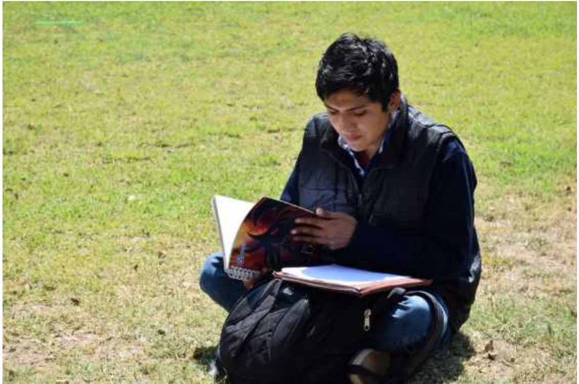
Estudio. Fotografía de un académico repasando sus lecturas en las áreas verdes de la Universidad.